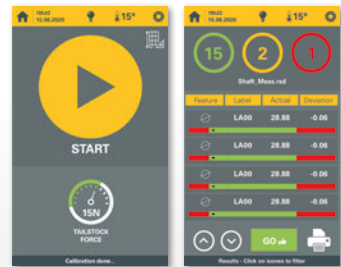
Neues Anwender-Touchpad einfach zu bedienen