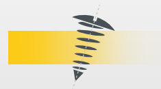
Exklusive Sylvac Schwenkeinrichtung, für umfangreiche Gewindemessungen.